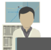
Konfigurer din PayPal-løsning