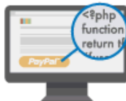
Ressourcer til udviklere