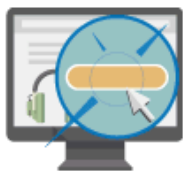
Website Payments Standard