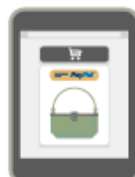
PayPal Express Checkout